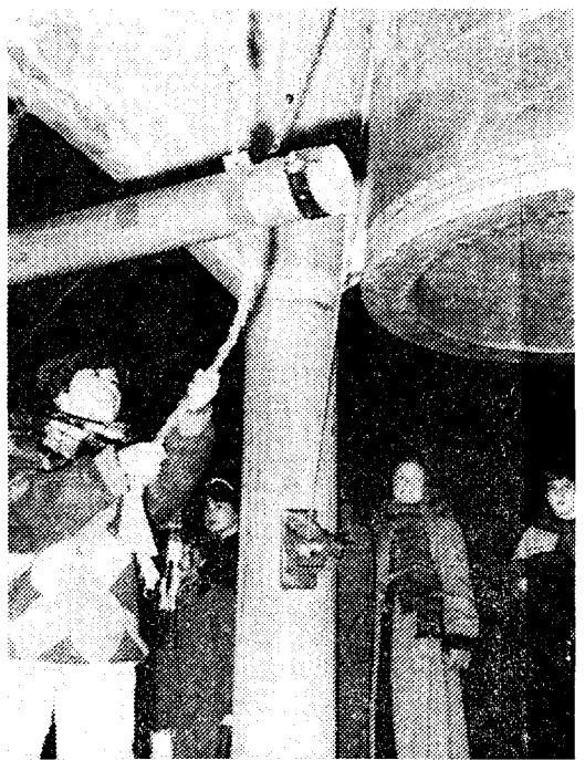
平和への祈りを込めて鐘を打ちならす市民ら— 広島市中区の平和記念公園で1日午前零時10分