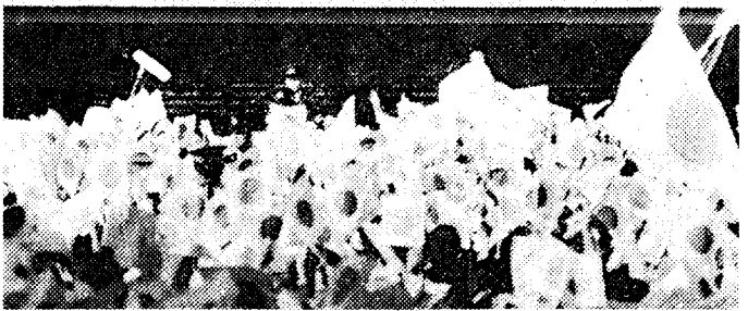
参賀の人たちに手をふって応えられる天皇ご一家 皇居東庭で2日午前10時15分

天皇后、皇后陛下は皇太子ご夫妻、浩宮さま、礼宮さま、常陸宮ご夫妻とともに午前中三回、午後四回、長和殿のベランダにお立ちになった。英国留学から帰国された浩宮さまは、三年ぶり、成年皇族になられた礼宮さまは初め。