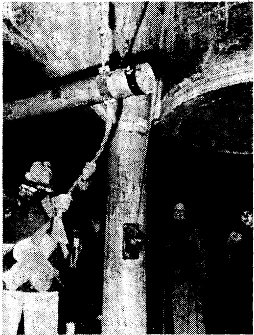
平和への祈りを込めて鐘を打ちならす市民ら＝ 広島市中区の平和記念公園で1日午前零時10分

国際平和年の幕開きに と、一日午前零時から広島市中 区中島町の平和記念公園内 にある平和の鐘が平和を祈る 市民や外国人の手で打ち鳴ら された。